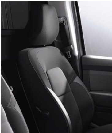
Υφασμάτινες επενδύσεις καθισμάτων σε μαύρο/γκρι χρώμα