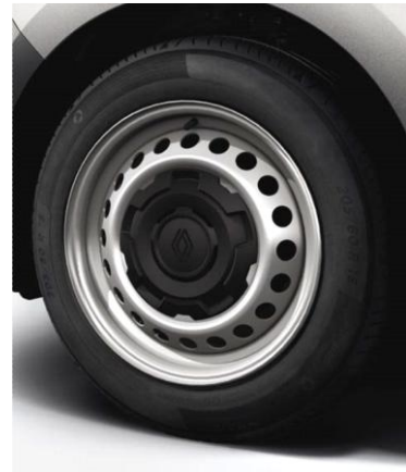
Τροχοί 16" & ελαστικά 205/60 R16