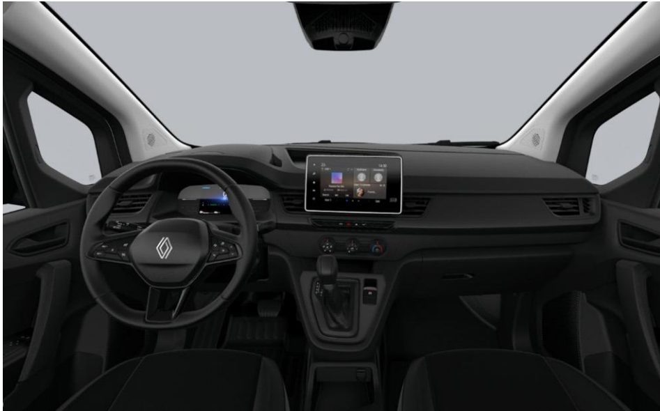
Πίνακας οργάνων οδηγού με οθόνη TFT 7" & σύστημα πολυμέσων με ψηφιακή οθόνη 8"