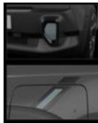
Διακοσμητικά αυτοκόλλητα προφυλακτήρων & εμπρός φτερών fl4sh blue