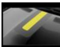
Διακοσμητικό αυτοκόλλητο καπό & οροφής fl4sh yellow