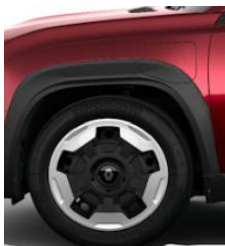
Τροχοί 18" "jogging" με δίδχρομο κάλυμμα & ελαστικά 195/60 R18