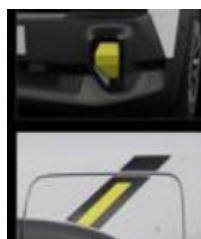
Διακοσμητικά αυτοκόλλητα προφυλακτήρων & εμπρός φτερών fl4sh yellow