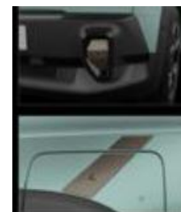
Διακοσμητικά αυτοκόλλητα προφυλακτήρων & εμπρός φτερών numbeR4 cooper

S=standard, -= μη διαθέσιμο Οι τιμές δεν περιλαμβάνουν ΕΤΤ & ΦΠΑ