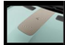
Διακοσμητικό αυτοκόλλητο καπό & οροφής numbeR4 cooper