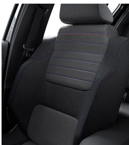
Υφασμάτινες επενδύσεις εμπρός καθισμάτων σε γκρι χρώμα με μπλε, λευκές και κόκκινες διακοσμητικές ραφές