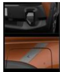
Διακοσμητικά αυτοκόλλητα προφυλακτήρων & εμπρός φτερών numbeR4 silver