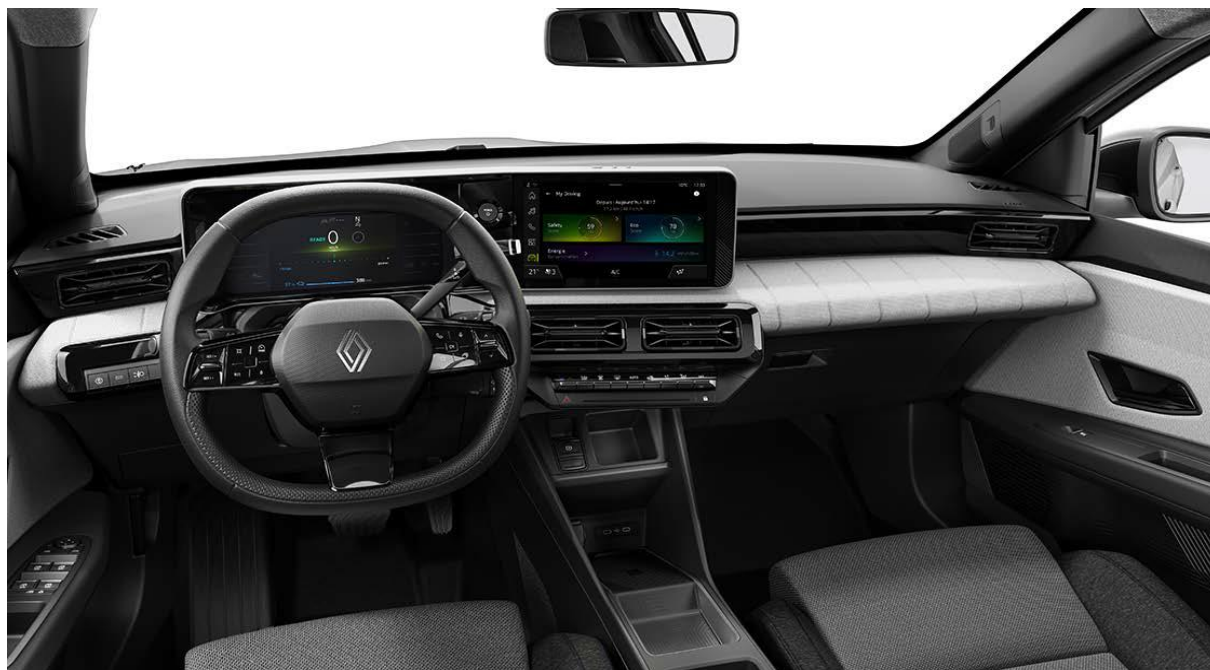
Ψηφιακός πίνακας οργάνων 7" & Σύστημα πολυμέσων openR link 10,1"