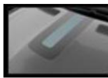
Διακοσμητικό αυτοκόλλητο καπό & οροφής fl4sh blue