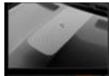
Διακοσμητικό αυτοκόλλητο καπό & οροφής numbeR4 silver